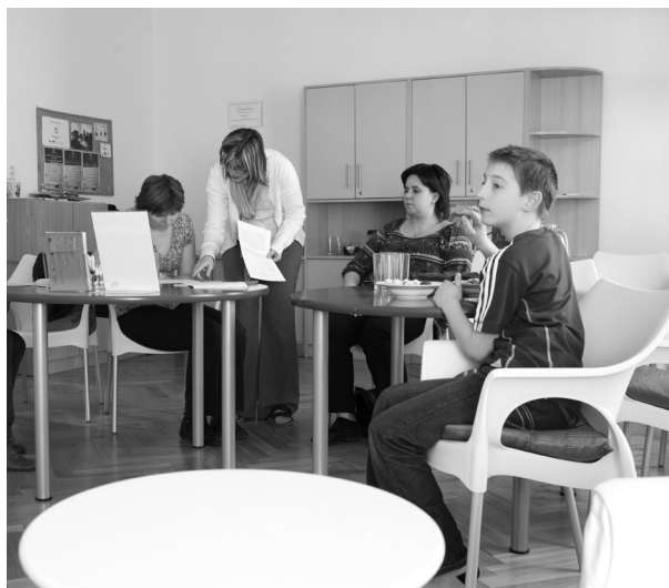
↑ Setkání rodičů v Centru Kašpar.

„Většího využití benefitu se docílí neutrálním prostředím, tj. pokud hlídání nebude probíhat v místě domova dítěte, ale na nějakém jiném místě. Mnoho potenciálních uživatelů zažívá „stres“, že k nim má někdo cizí přijít domů. Tzn. pokud je to možné, vyčlenit na hlídání zvláštní prostor zařízený pro potřeby dětí, což může být na druhou stranu mnohdy komplikované.“