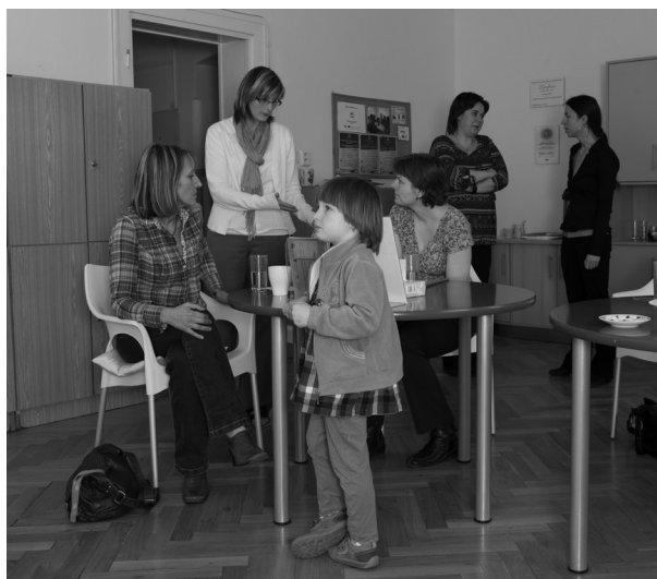
↑ Setkání rodičů v Centru Kašpar.

„Rozhodně bychom ho doporučili. Důvodů je několik – od nižší nemocnosti (resp. absencí), až po spokojenost zaměstnanců i jejich dětí.“